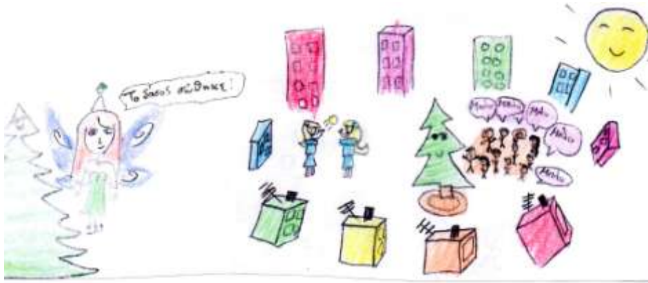
Αφίσες των μαθητών